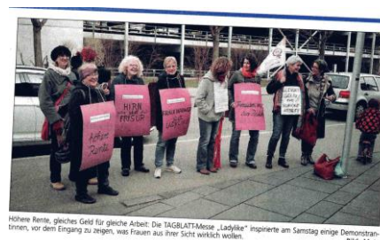
Höhere Rente, gleiches Geld für gleiche Arbeit: Die TAGBLATT-Messe „Ladylike“ inspirierte am Samstag einige Demonstrantinnen, vor dem Eingang zu zeigen, was Frauen aus ihrer Sicht wirklich wollen.

Im März 2016 riefen wir spontan zu einer Aktion anlässlich der vom Schwäbischen Tagblatt durchgeführten sogenannten Ladylike-Messe auf. Damit zeigten wir ein vielfältiges Bild dessen was „ladylike“ sein könnte und „was Frauen wollen“ – so ein Slogan aus der Werbung für diese Messe. Vor dem Messegelände diskutierten wir darüber mit Besuchern_Innen und tauschten uns über Bilder, Vorstellungen, eigene Erfahrungen und Ideen zu „ladylike“ aus.