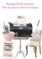
Feministisch serviert: Eine Lesung in mehreren Gängen

schon älteren Fragebogen.“ Dieser und die vorgelesenen Texte stießen auf eine sehr positive Resonanz auch des ‚Lauf-Publikums‘.